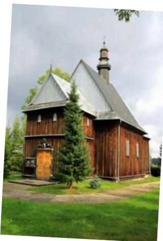
Kościół w Rakoszynie.