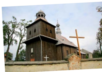
Kościół w Obiechowie.