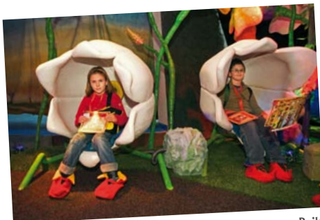
Europejskie Centrum Bajki im. Koziołka Matołka w Pacanowie.

Właśnie na kanwie postaci z książek Kornela Makuszyńskiego powstało tu Europejskie Centrum Bajki im. Koziołka Matołka. Budynek wyglądem przypomina babki z piasku, gdyż został zbudowany właśnie z myślą o najmłodszych. Można tu odwiedzić, razem z Piotrusiem Panem czy Królową Śnieżką, którzy są jednymi z przewodników, wystawę interaktywną „Bajkowy Świat”. Oprócz tego można w „Skarbnicy Bajek” zobaczyć w szklanych kulach bajki z całego świata, a w „Czarodziejskim Ogrodzie” spotkać Calineczkę. Można też wybrać się w multimedialną podróż „Bajkowym Pociągiem”. Warto dodać, że co roku w Pacanowie odbywa się Festiwal Kultury Dziecięcej.