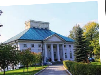
Pałac Badenich w Bejscach.

Już w X wieku istniał tu najprawdopodobniej gród rycerski. W tej miejscowości znajduje się gotycki kościół św. Mikołaja z XIV wieku. Cenniejsza jest jednak