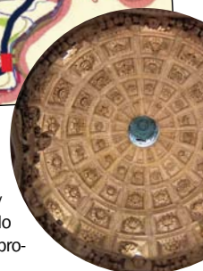
Kaplica Firlejów w Bejscach.

dobudowana do świątyni kaplica Firlejów. Wzniesiona w latach 1596 - 1600, z piękną dekoracją rzeźbiarską, stanowi perelkę małej architektury sakralnej w Polsce. W Bejskach zlokalizowany jest klasycystyczny pałac z 1802 r. Jest on wyglądem zbliżony do warszawskiego Belwederu, gdyż oba budynki miały tego samego projektanta, czyli Jakuba Kubickiego.