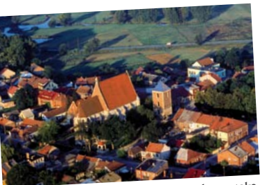
Wiślica, centrum z lotu ptaka.